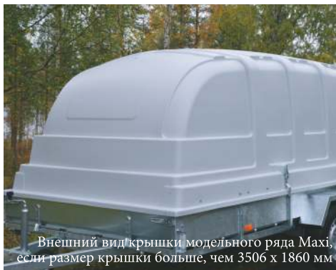
Внешний вид крышки модельного ряда Maxi, если размер крышки больше, чем 3506 x 1860 мм